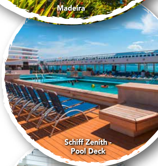
Schiff Zenith - Pool Deck

(Balkonkabinen zusätzlich mit Balkon, Juniorsuite ca. 19 m 2 . Achtung es gibt nur eine geringe Anzahl an Balkonkabinen und Juniorsuiten)